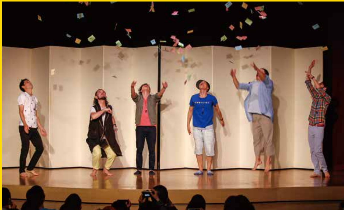
ロクディム

その場その時、集まった観客と一緒に作り上げる笑いに満ち溢れた空間を、是非ご堪能あれ!